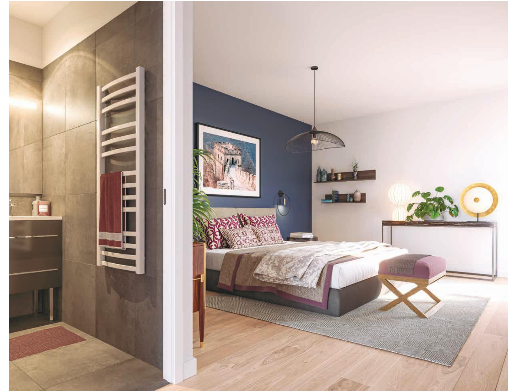
Vue sur une suite parentale

La résidence, labellisée RT 2012, est optimisée pour éviter les pertes de chaleur et ainsi bénéficier d'une réduction de consommation énergétique.