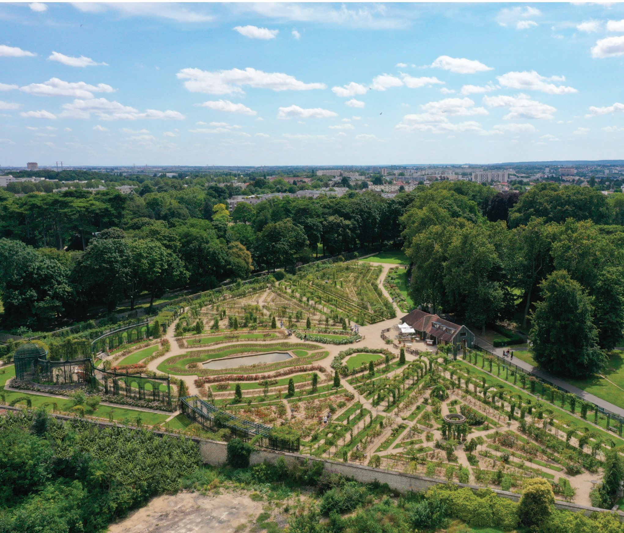
Vue du parc départemental de la Roseraie