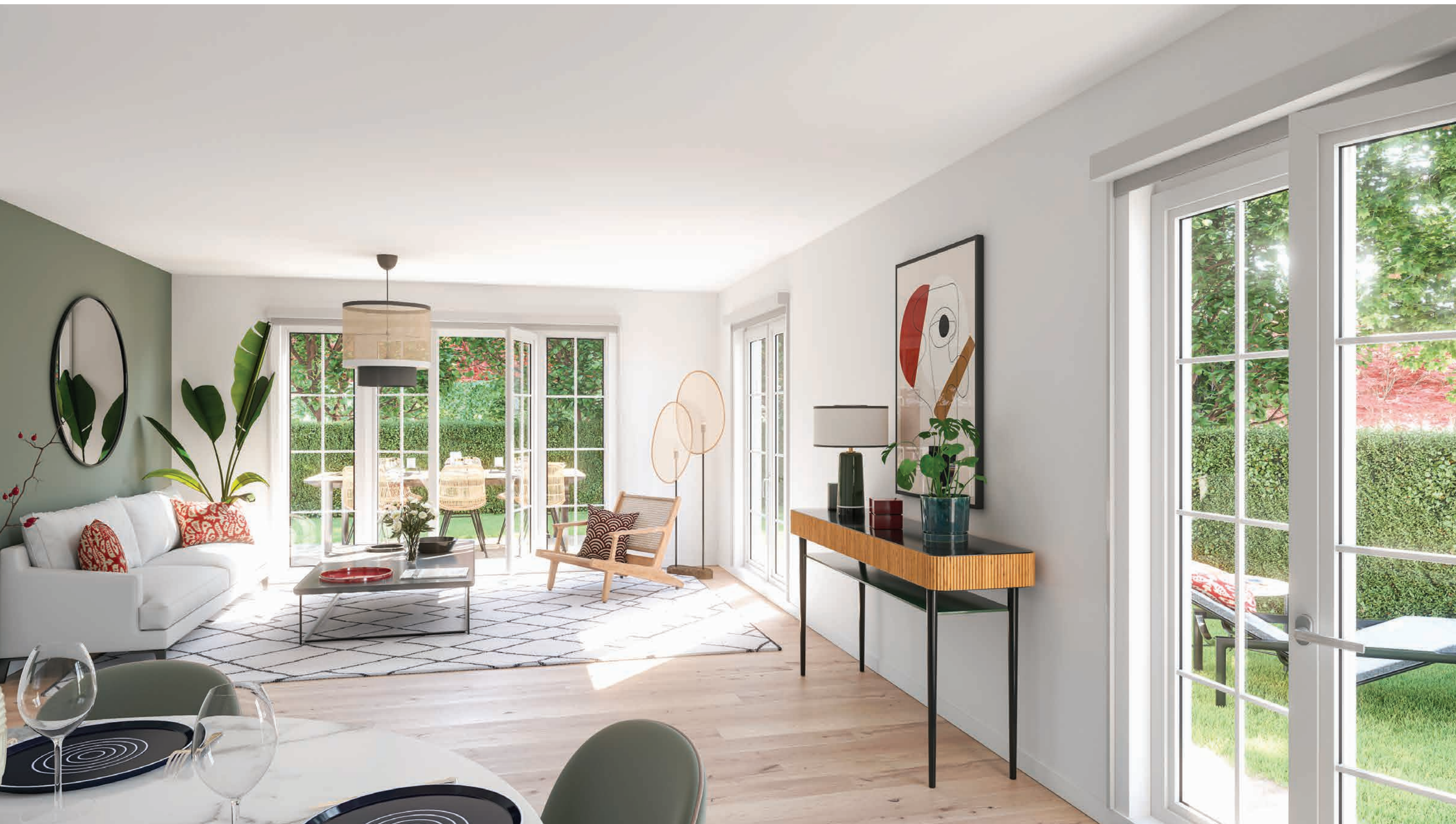
Vue sur le séjour d'un appartement 4 pièces ouvert sur sa terrasse et son jardin privatif