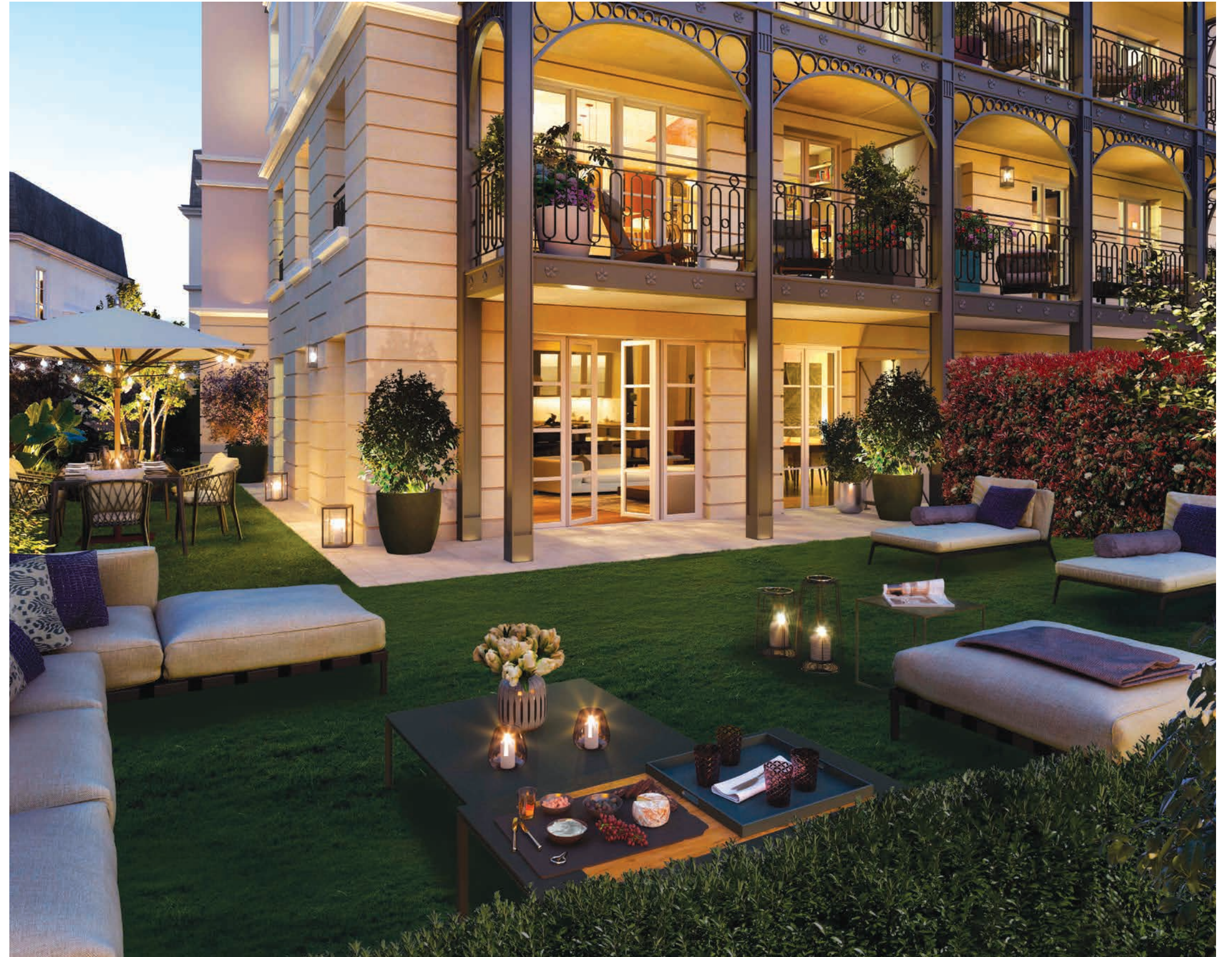
Vue d'un jardin privatif