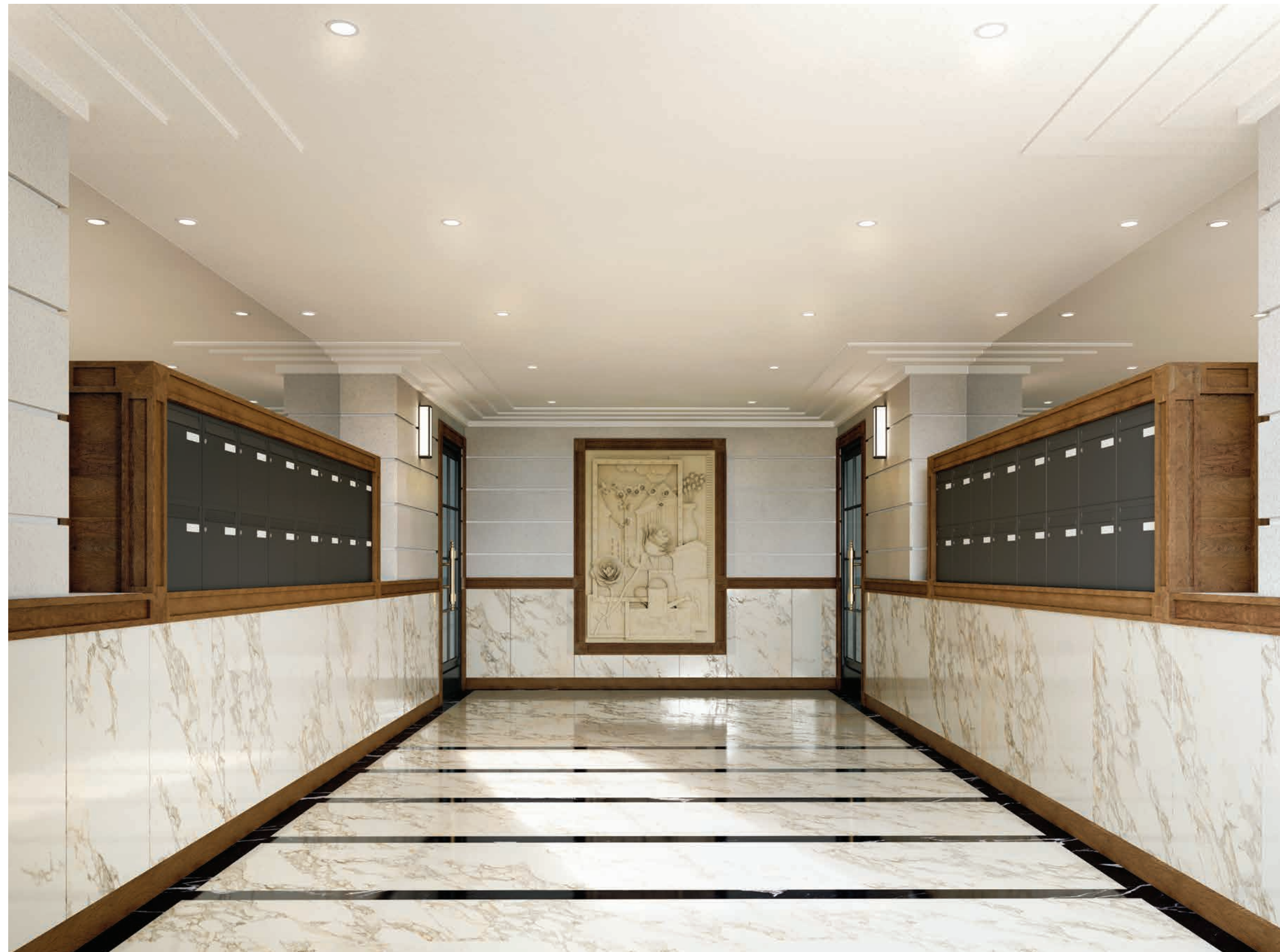
Vue d'un hall de la résidence

Défenseur passionné de la création contemporaine, Emerige accompagne des artistes de la scène française. En tant que premier signataire de la chartre « 1 immeuble, 1 œuvre », le Groupe contribue à l'essor de l'art dans la ville en installant une œuvre dans chaque immeuble qu'il construit ou réhabilite. Depuis 2016, près de 60 œuvres ont été commandées ou acquises.