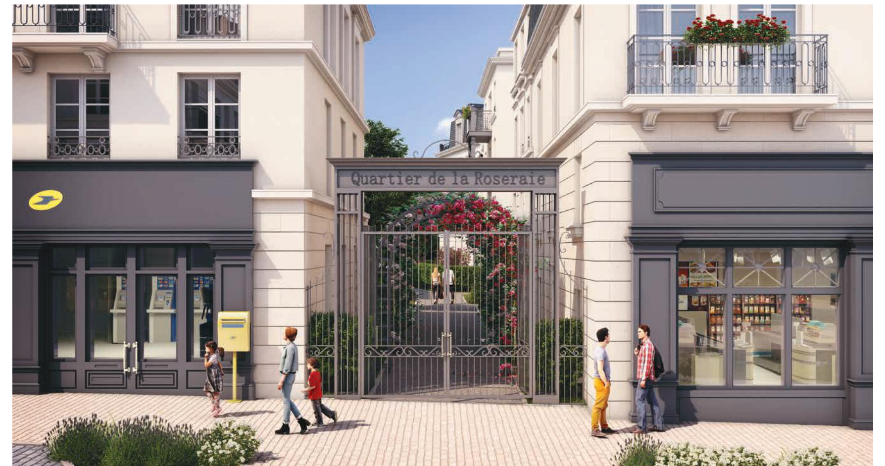
Vue d'une entrée de la résidence

En hommage à la Roseraie, une essence de rose sera spécialement créée pour l'inauguration de la résidence.