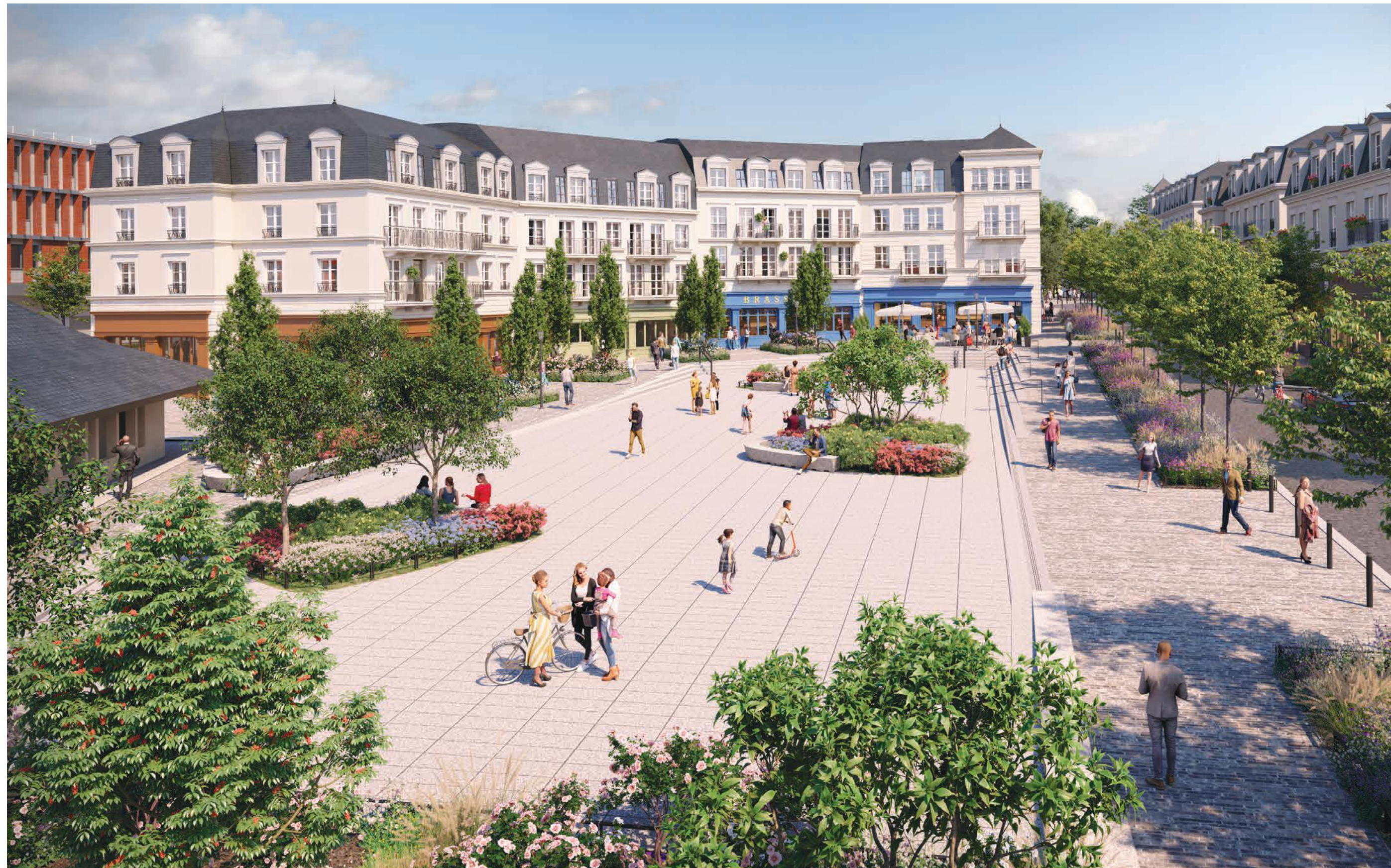
Vue de la place réaménagée