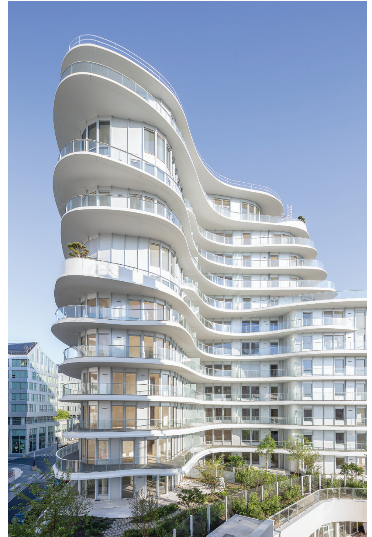
Unic - PARIS | 17

Emerige, société par actions simplifiée au capital de 3 457 200 €, immatriculée au RCS de Paris sous le numéro 350 439 543 - Siège social : 121 avenue de Malakoff 75116 Paris - Architecte : Breitman & Breitman Architectes - Perspectivistes : Miysis, Visual-FL, Scenesis, Citallios - Illustrations non contractuelles à caractère d'ambiance - Document et informations non contractuels - Réalisation : markus - 01/2025