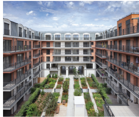
Quartier des arts - PUTEAUX | 92

Après avoir inauguré en 2019 "Unic", situé dans l'écoquartier des Batignolles (Paris 17 e ) et conçu par les architectes M.A.D et Christian Biecher, Emerige a livré de nombreux autres projets comme "10 rue Danton" à Pantin, une résidence aux abords du Canal de l'Ourcq imaginée par le cabinet Avenier Cornejo, le projet "Allée de Meudon" à Clamart pensé par Jenny & Lakatos, la résidence "Quartier des arts" à Puteaux élaborée par le Cabinet Vigneron ou encore "21 Jean Jaurès" à Gentilly imaginée par Daquin & Ferrière Architecture.