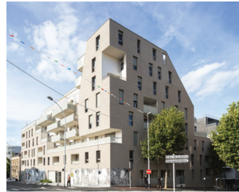
21 Jean Jaurès - GENTILLY | 94