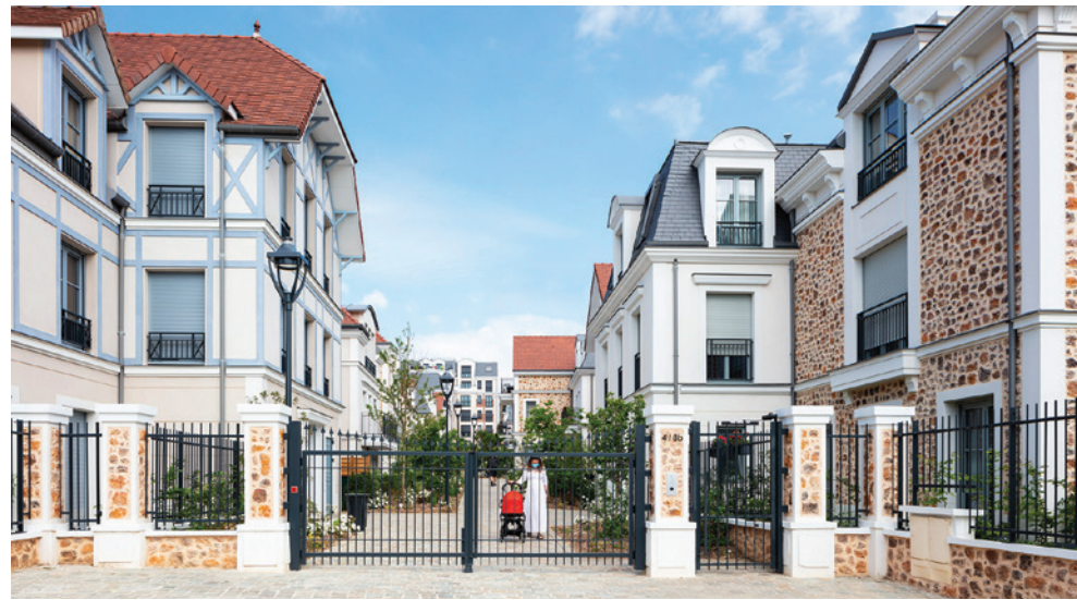
Allée de Meudon - CLAMART | 92