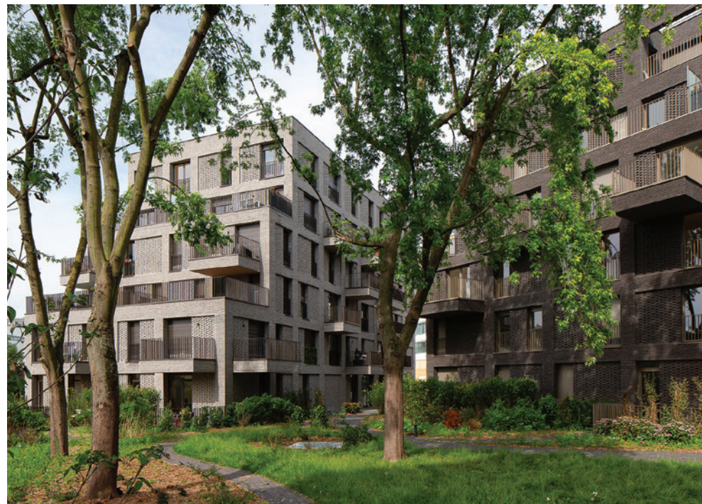
10 rue Danton - PANTIN | 93