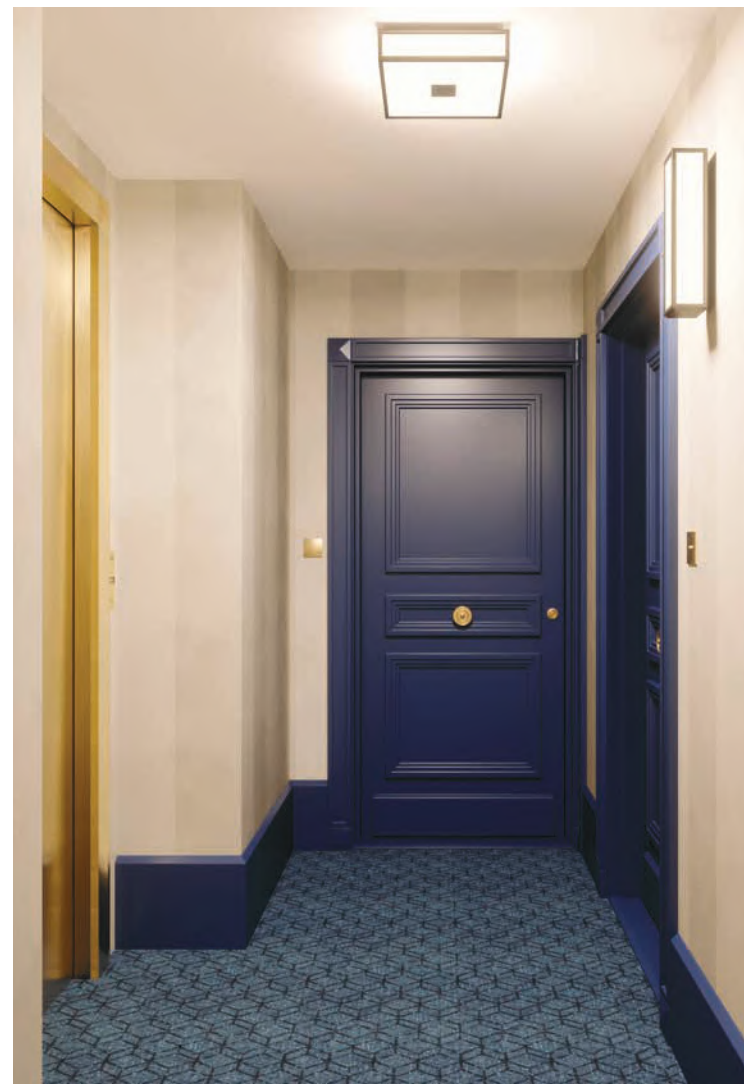
Vue d'un palier de la résidence

Le travail du bois sur les portes palières en étage forme un parti pris contemporain où les touches de bleu et de doré se mêlent aux teintes claires des murs et du plafond.