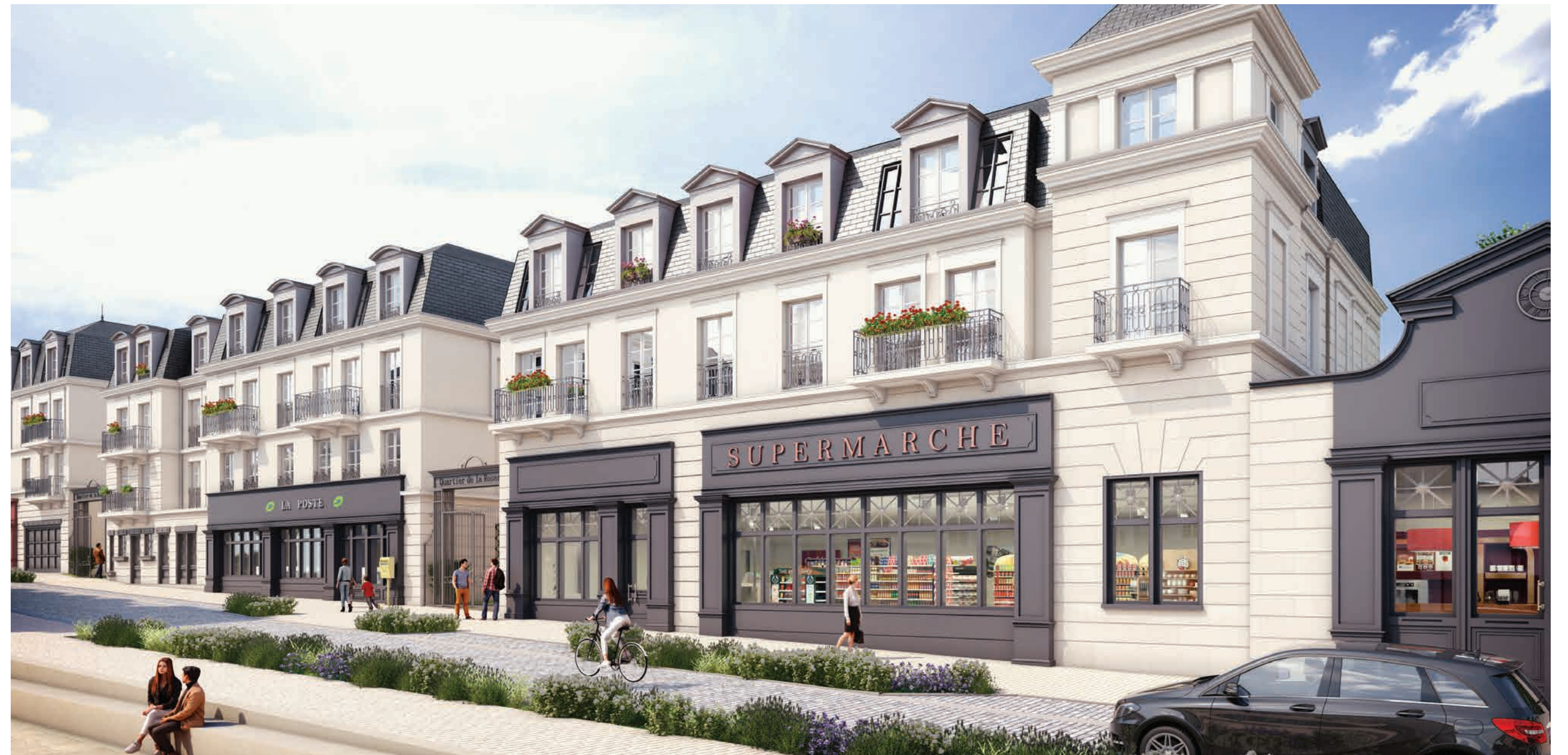
Vue de la rue Watel donnant sur une entrée de la résidence