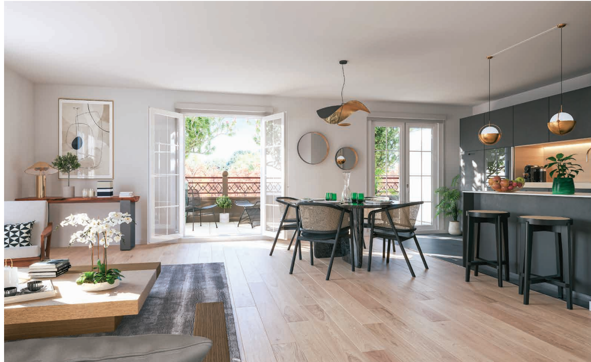
Vue sur le séjour d'un appartement 5 pièces