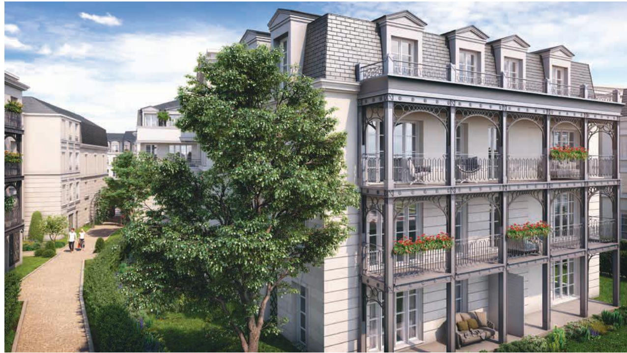
Vue sur un bâtiment côté Roseraie et sa venelle