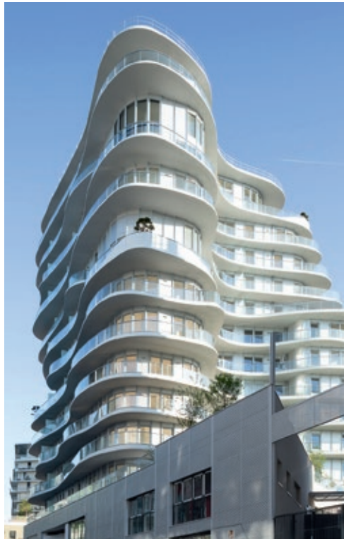
Unic - PARIS | 17

Emerige, société par actions simplifiée au capital de 3 457 200 €, immatriculée au RCS de Paris sous le numéro 350 439 543 - Siège social : 121 avenue de Malakoff 75116 Paris. Architecte : Atelier Allione - Perspectivistes : La Fabrique à Perspectives - Illustrations non contractuelles à caractère d'ambiance. Document et informations non contractuels - Réalisation : communeimage.net - 03/2024