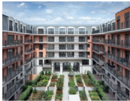
Quartier des arts - PUTEAUX | 92