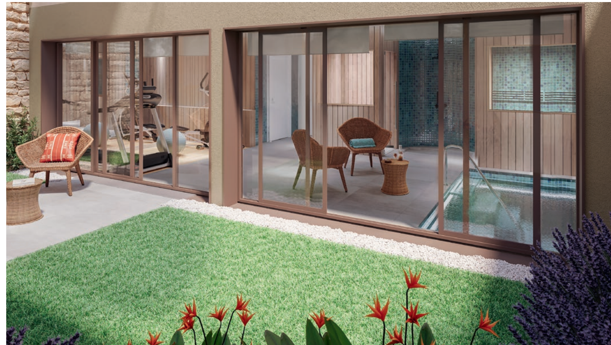
Vue de l'espace bien-être partagé en rez-de-jardin

Pour parfaire un confort sans concession, la résidence dispose d'un espace de bien-être aux services dignes d'un resort.