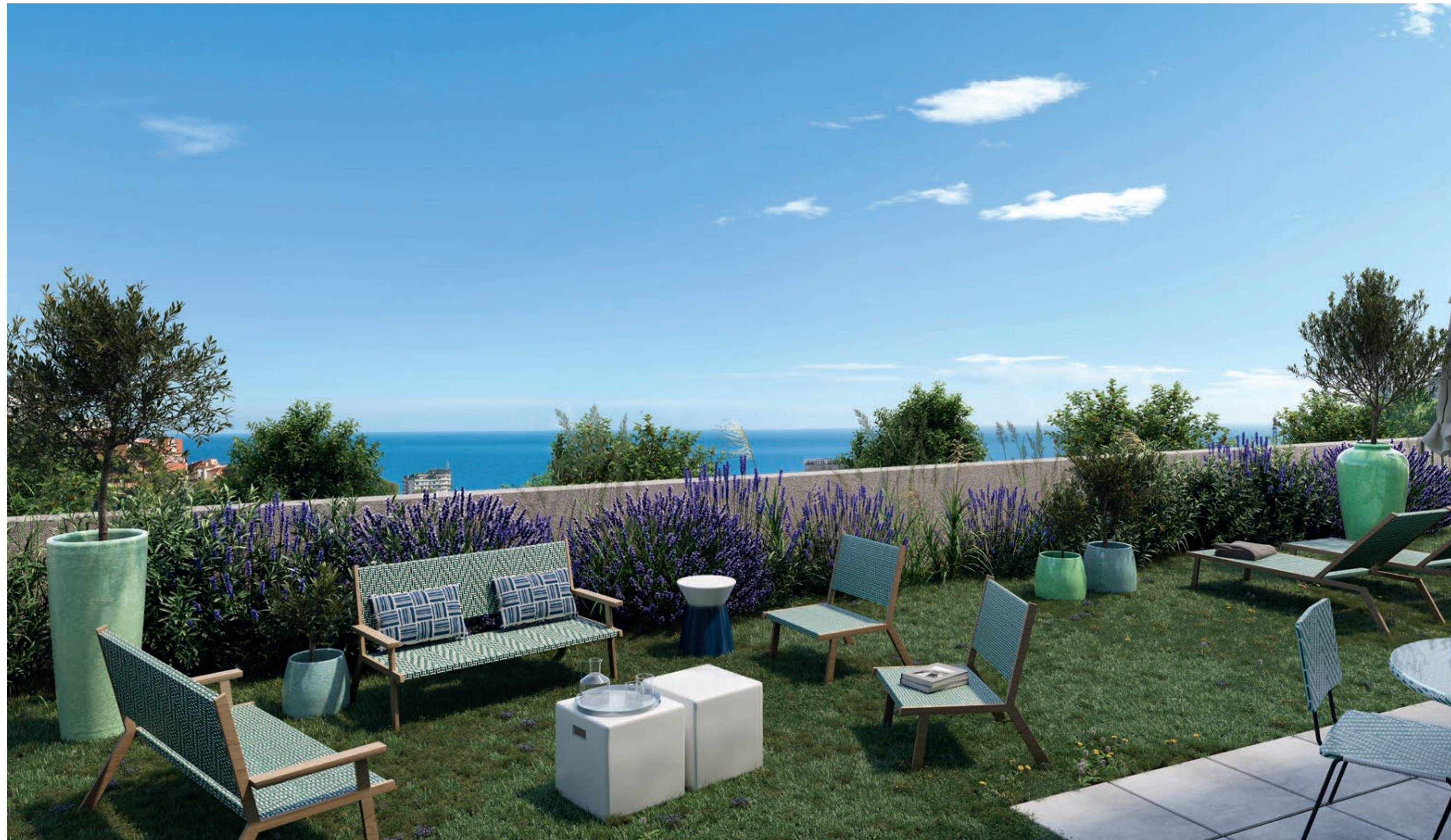
Vue d'un rez-de-jardin