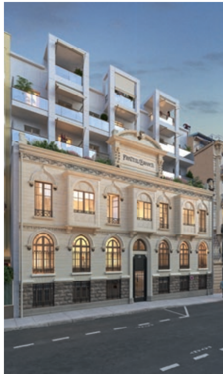
28 Berlioz - NICE | 06