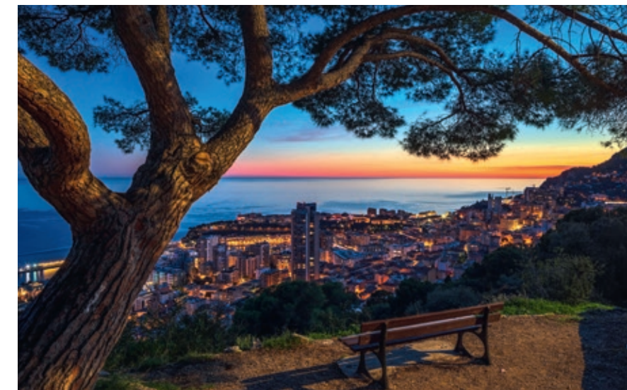
Le Parc Grima surplombant la résidence