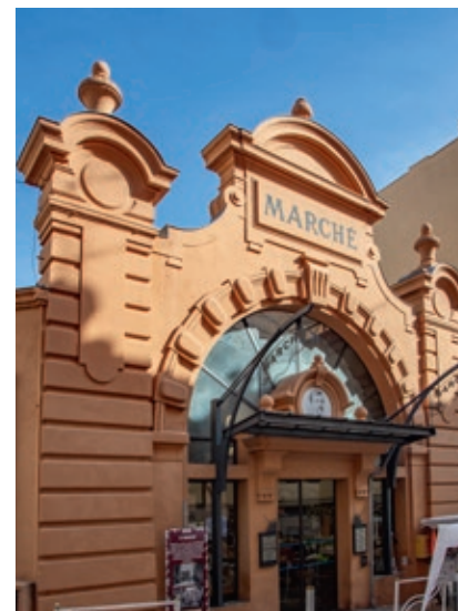
Le marché couvert de Beausoleil