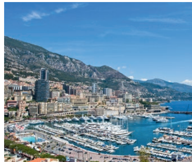
Le port Hercules de Monaco