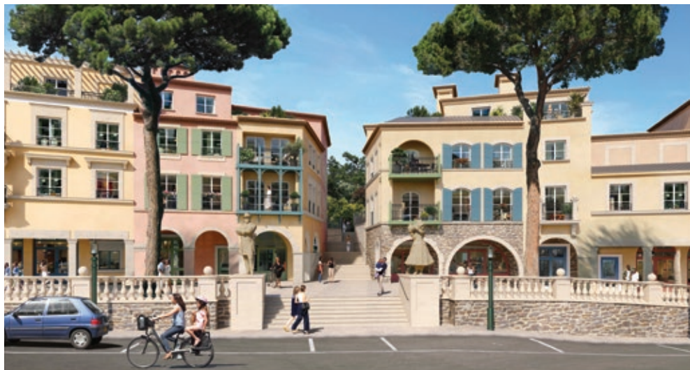
Chemin des Comtes de Provence - LE ROURET | 06