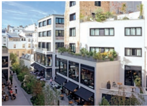
Beaupassage - PARIS | 17