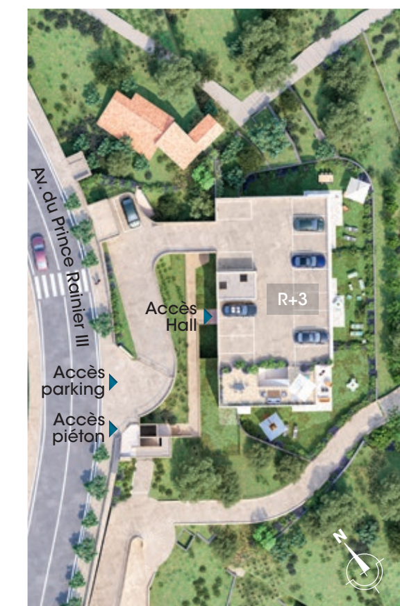
Plan de masse de la résidence