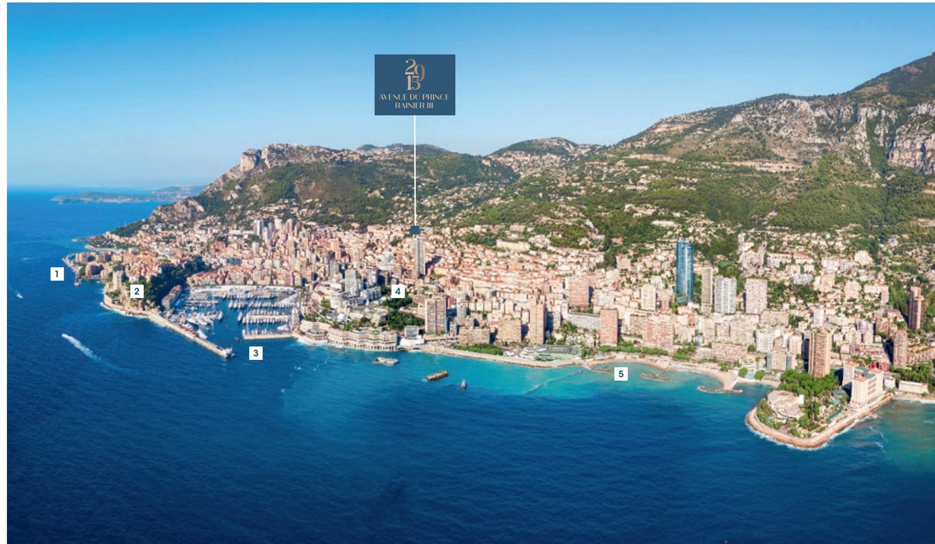
1 Port et quartier d'affaires de Fontvieille | 2 Le Rocher et le Palais Princier | 3 Port Hercules | 4 La place du Casino et l'Opéra Garnier | 5 La plage du Larvotto