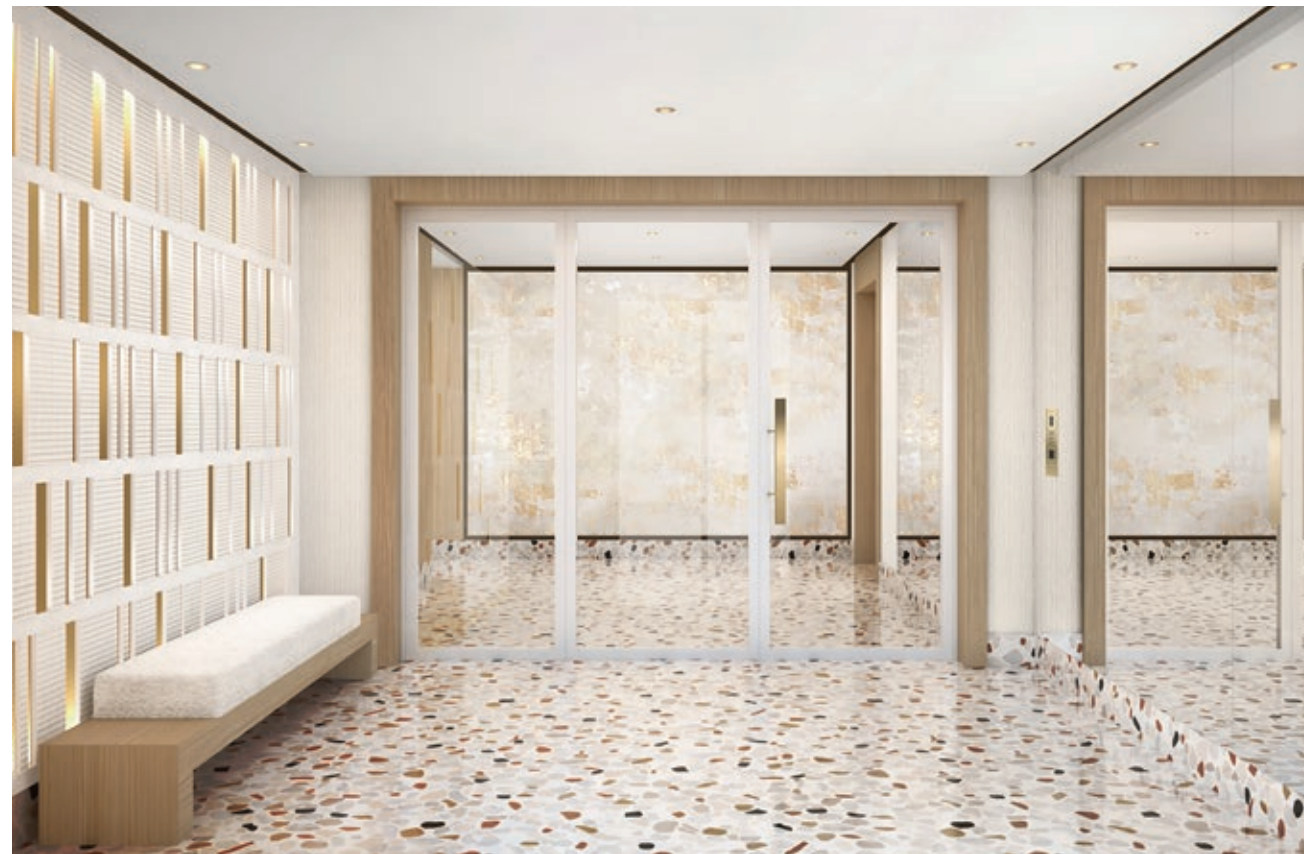
Vue du hall d'entrée

Anne-Catherine Pierrey Architecte d'Intérieur