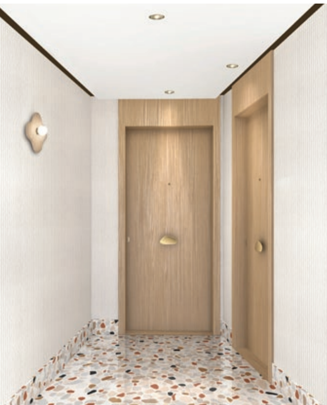
Vue d'un palier d'étage