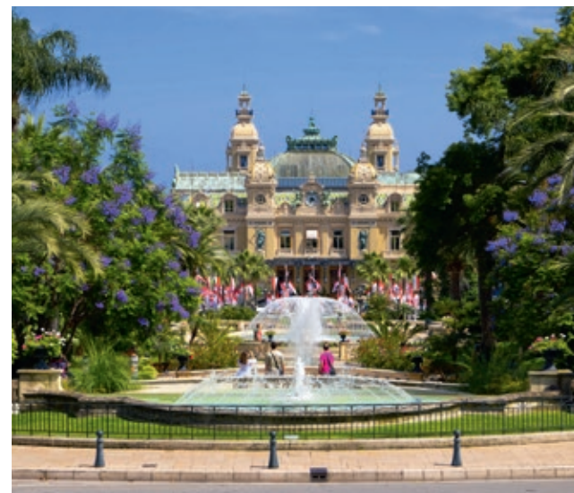
La place du casino de Monaco