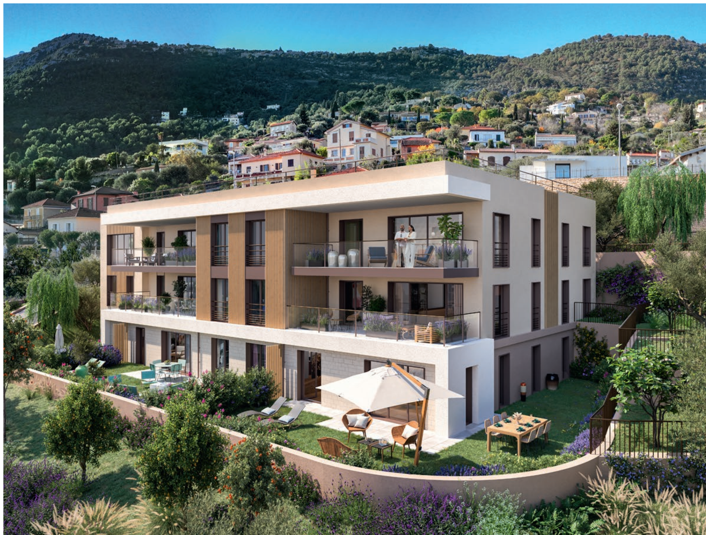
Vue de la résidence depuis le jardin paysager