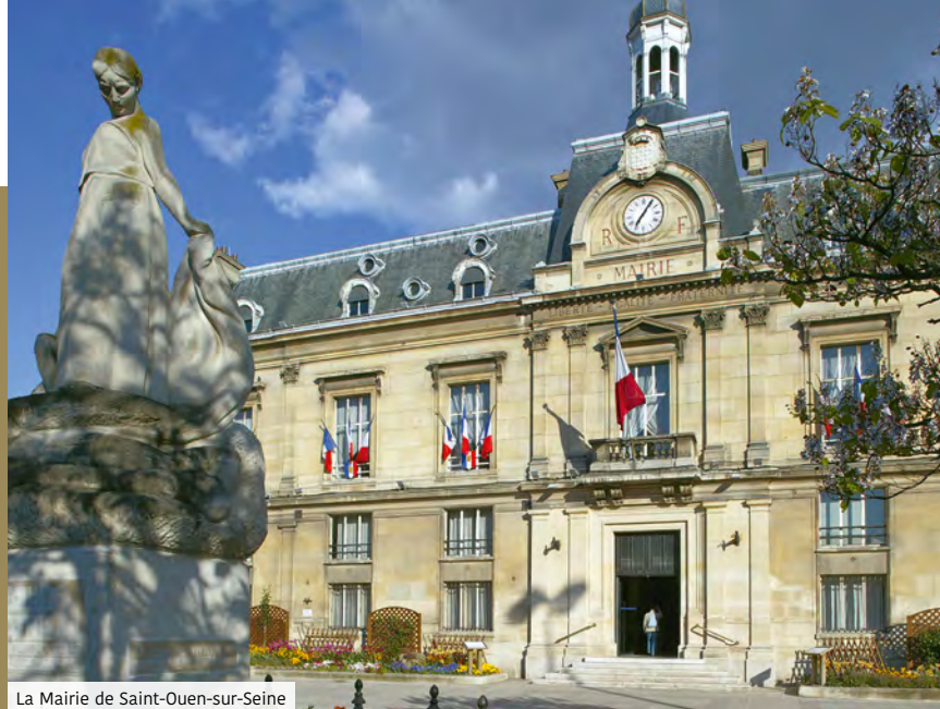
La Mairie de Saint-Ouen-sur-Seine

Une belle qualité de vie et une excellente desserte confèrent par ailleurs un réel dynamisme à la ville, en mouvement permanent. Desservie par le RER C et le métro ligne 13, Saint-Ouen-sur-Seine a accueilli la ligne 14 du métro pour rejoindre facilement le centre de Paris.