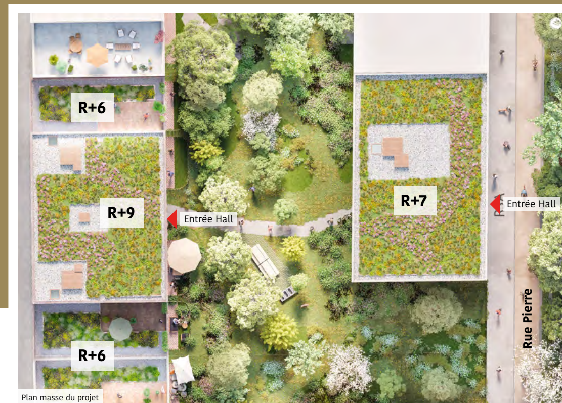
Plan masse du projet

Les jardins de la résidence répondent aux ambitions écologiques du quartier à travers la multiplication des espaces en pleine terre, la trame verte et la gestion de la faune et de la flore.