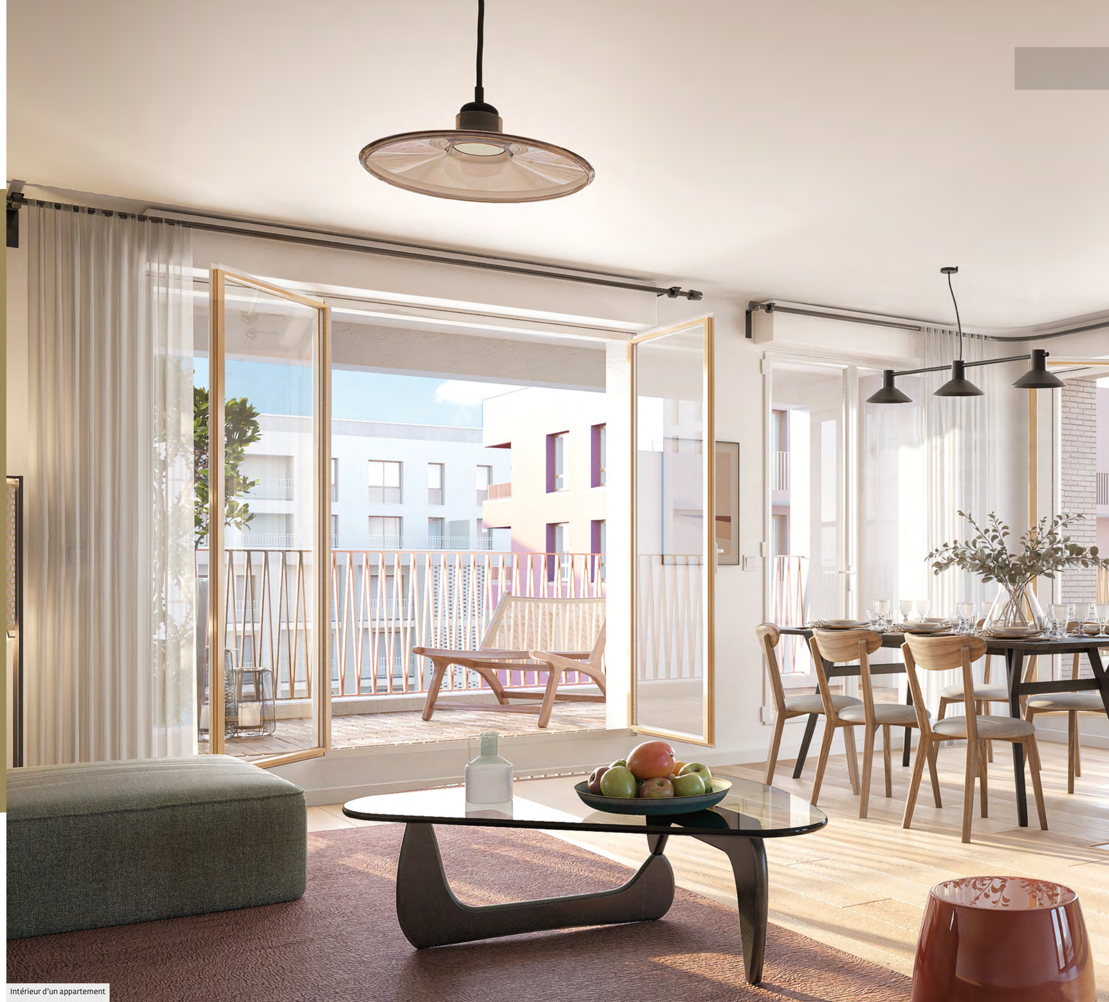
Intérieur d'un appartement

Enfin, pour plus de facilité, quelques appartements bénéficient d'une cave.