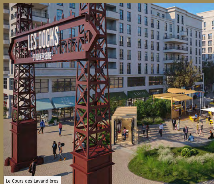
Le Cours des Lavandières

Les nombreux établissements scolaires, de la maternelle au lycée, accompagnent la vie des familles. La pratique du sport est facilitée à travers de nombreuses associations et des équipements, comme l'espace nautique Auguste-Delaune ou le stade Bauer.