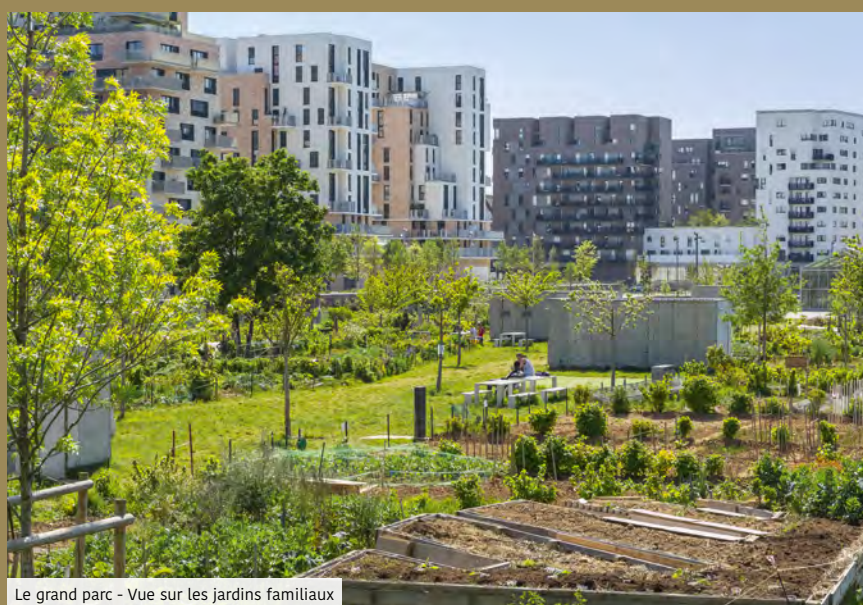
Le grand parc - Vue sur les jardins familiaux