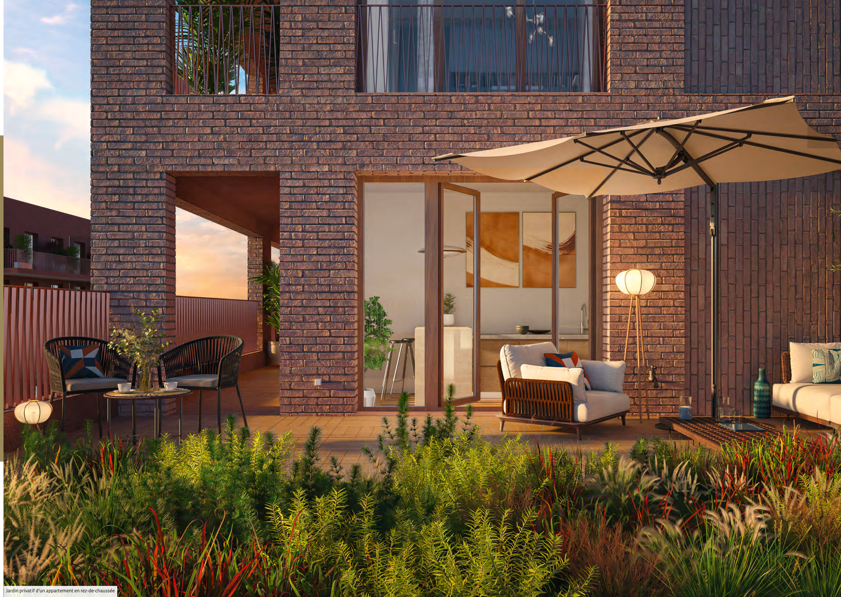
Jardin privatif d'un appartement en rez-de-chaussée