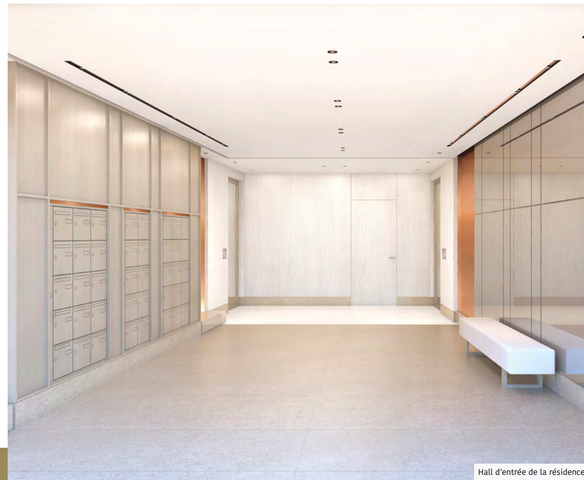
Hall d'entrée de la résidence