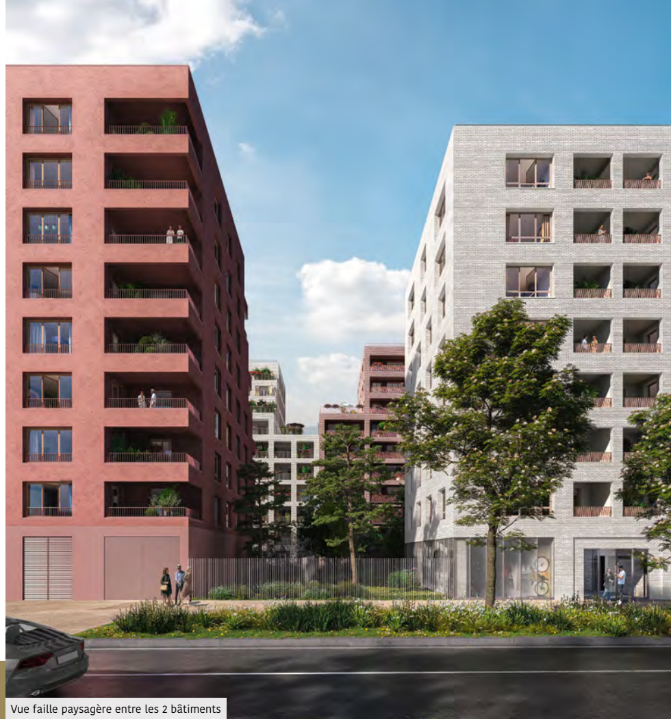
Vue faille paysagère entre les 2 bâtiments