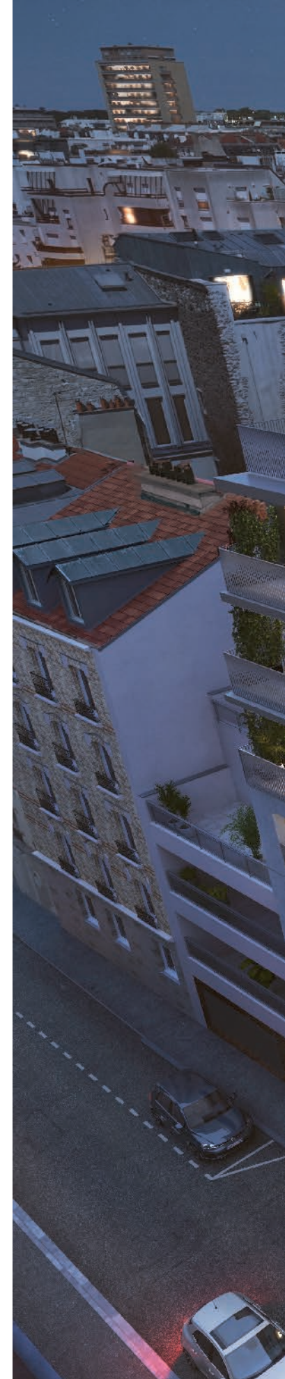
Vue sur le Passage de Châteaudun

Julien Rousseau - Agence FRESH Architectures