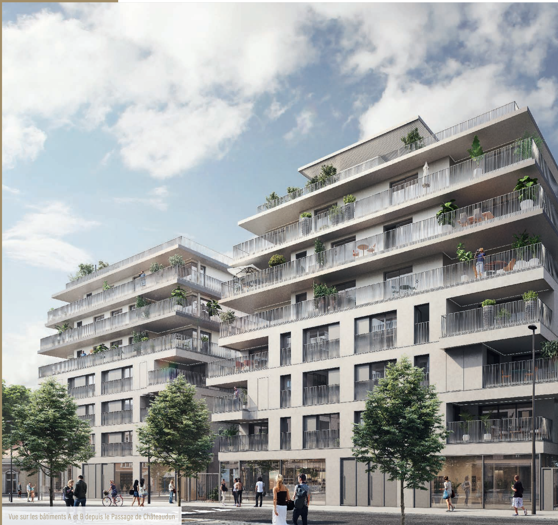
Vue sur les bâtiments A et B depuis le Passage de Châteaudun