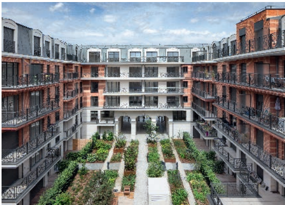
QUARTIER DES ARTS - PUTEAUX I 92 Architectes : Cabinet Vigneron Co-promotion Emerige, OGIC et BFD