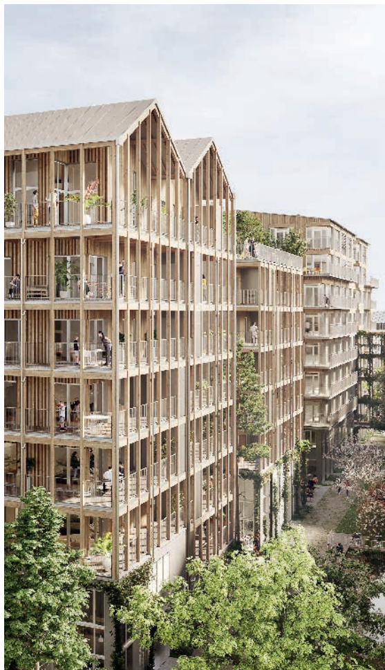
ILOT BERGERON - NANTES Architecte : Alexandre Chemetoff