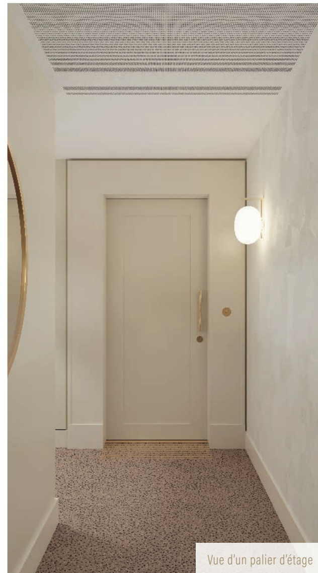
Vue d'un palier d'étage

Ouverts sur la ville par de généreuses baies vitrées, les halls découvrent d'apaisantes cours végétalisées, sublimes par un délicat jeu de miroir. Dès les premiers pas, la noblesse des matériaux, à l'instar du bois, se marie à des coloris chauds et des luminaires design, apportant à l'ensemble une atmosphère naturelle et chaleureuse. Cette douce harmonie de formes, couleurs et métaux dévoile des espaces empreints d'unité et de raffinement.