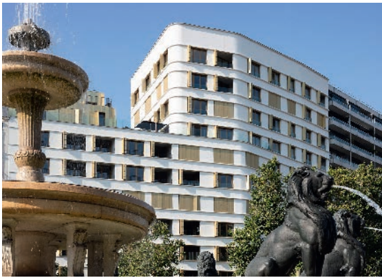
PLACE FÉLIX EBOUÉ - PARIS I 12 Architectes : Baumschlager Eberle Architectes Co-promotion Emerige et Inovalis