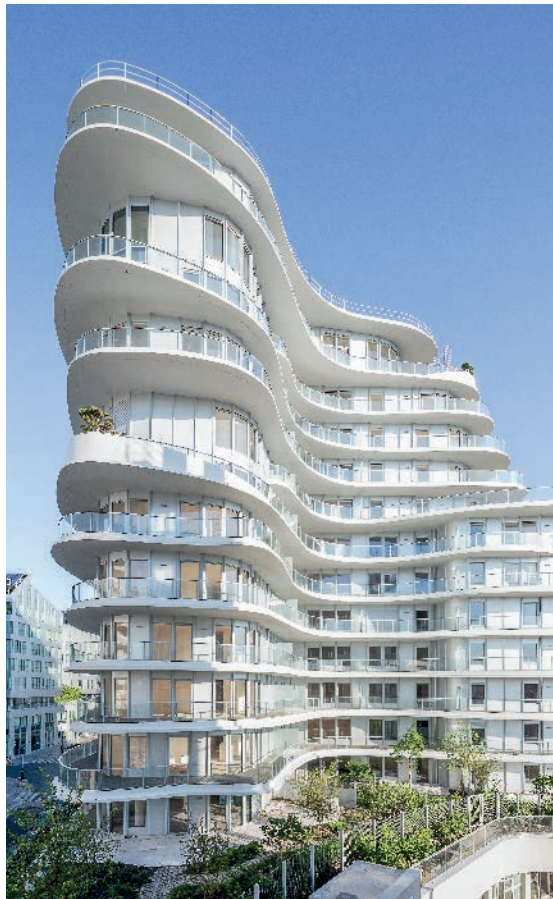
UNIC - PARIS I 17 Architectes : MAD Architects et Biecher Architectes