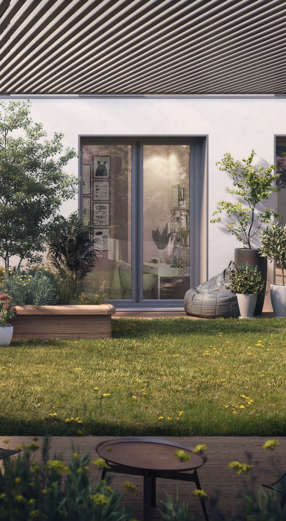
Vue sur le jardin privatif d'un appartement 4 pièces