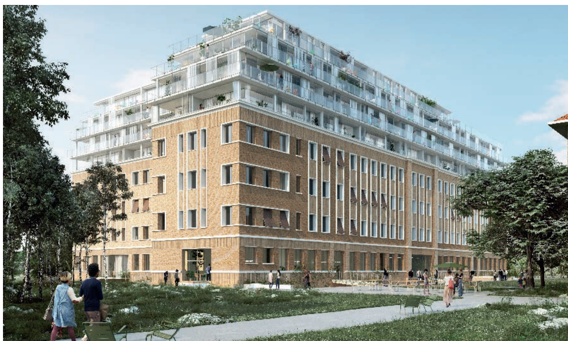
PAVILLON RASPAIL - PARIS | 14 Architectes : Lacaton & Vassal - Redelsperger

QUARTUS est un ensemble urbain implanté sur 6 grands territoires en France et dont la vocation est de fabriquer des villes qui s'inspirent et prennent soin du vivant. Des villes plus humaines et plus diverses, plus solidaires et plus responsables.