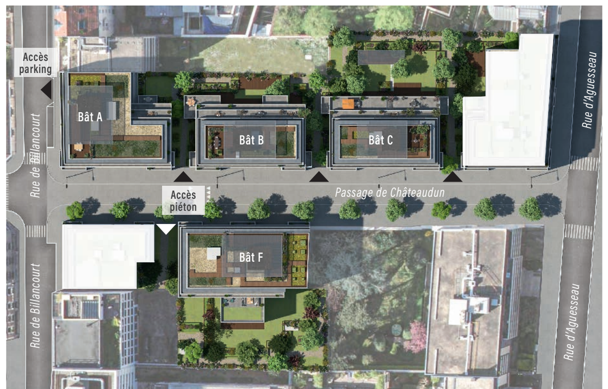
Les aménagements représentés sur les visuels sont à titre indicatif.

Pour le confort de tous, des locaux à vélos et des parkings en sous-sol sont accessibles depuis l'intérieur.