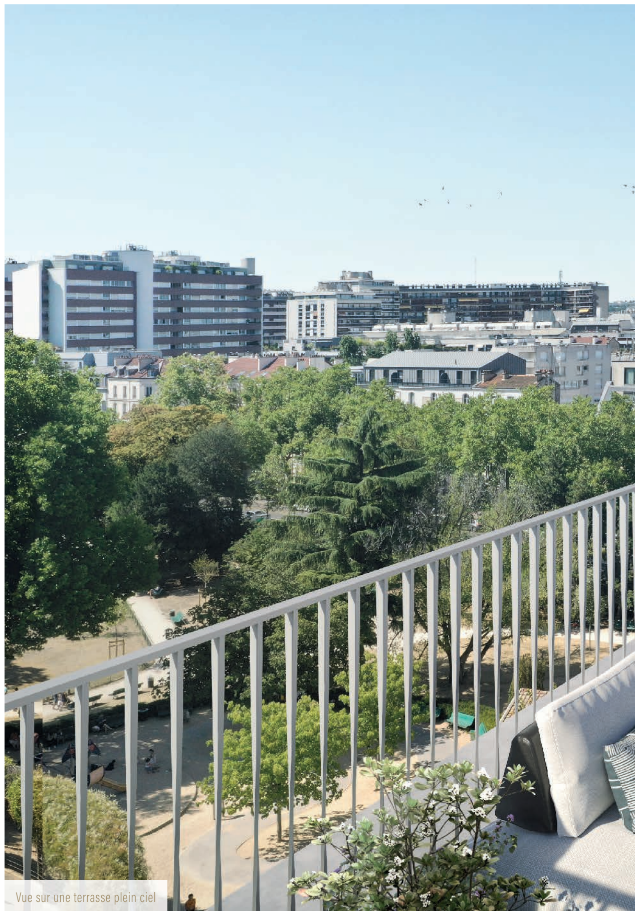
Vue sur une terrasse plein ciel

Pour quelques privilégiés aux derniers étages, de magnifiques terrasses en rooftop viennent sublimer le quotidien. Gage de détente et véritables pièces supplémentaires aux beaux jours, elles offrent des vues panoramiques incroyables sur le paisible square Léon Blum et l'horizon bouloonnais.