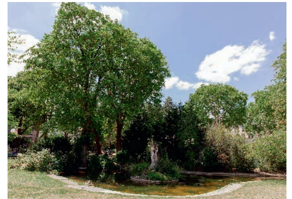
Square Léon Blum

* Source : Google Maps. Temps de trajet donné à titre indicatif.