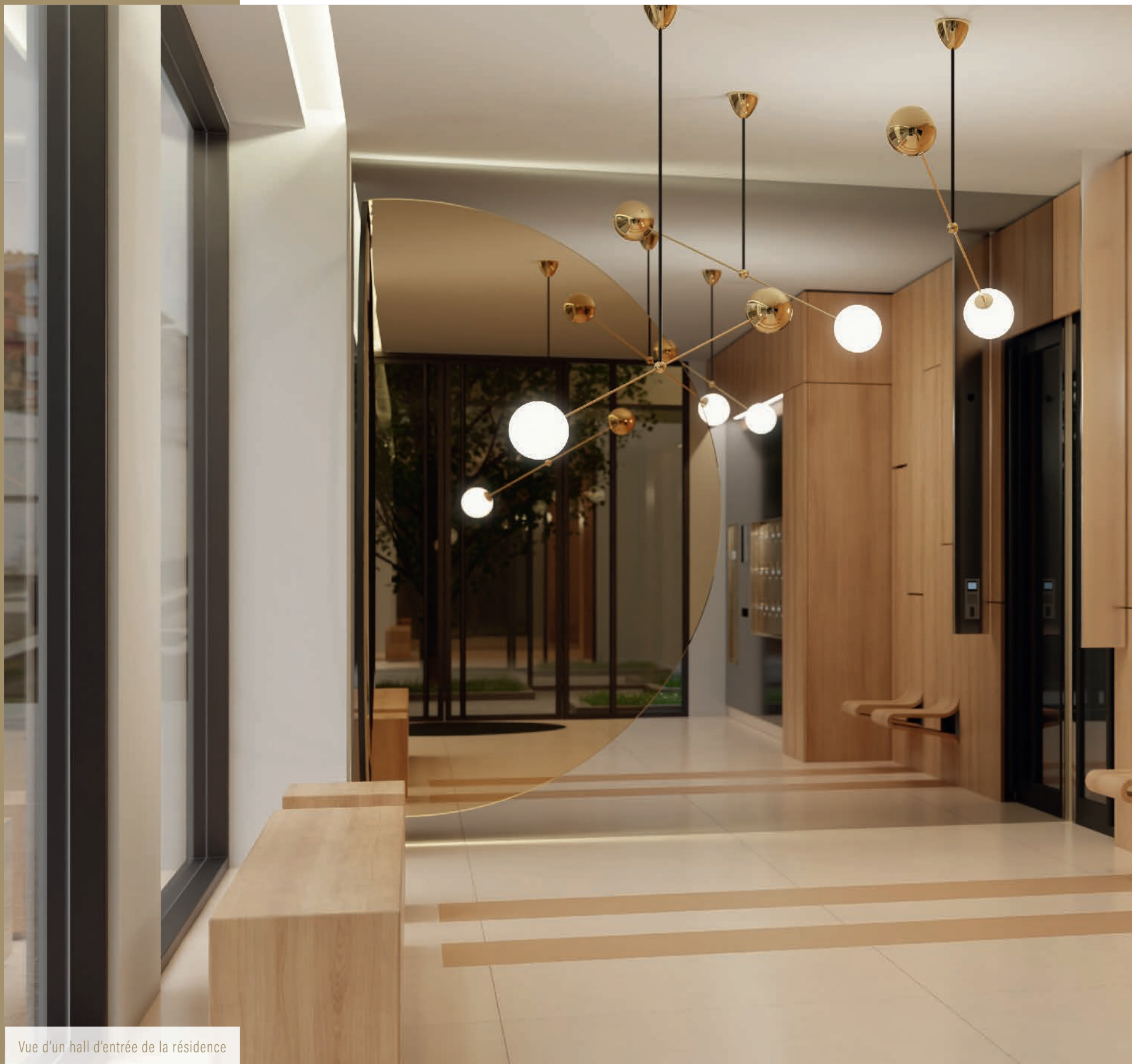
Vue d'un hall d'entrée de la résidence