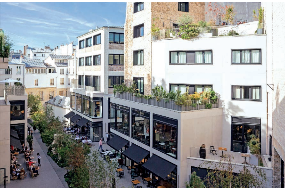
BEAUPASSAGE - PARIS I 7 Architectes : B&B Architectes et Franklin Azzi Architecture