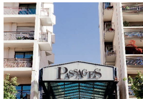
Centre commercial « Les Passages »

Plus au sud, les sièges d'entreprises, acquis à la qualité de vie des nouvelles Rives de Seine, en font un centre d'affaires incontournable, à seulement quelques minutes de la capitale.