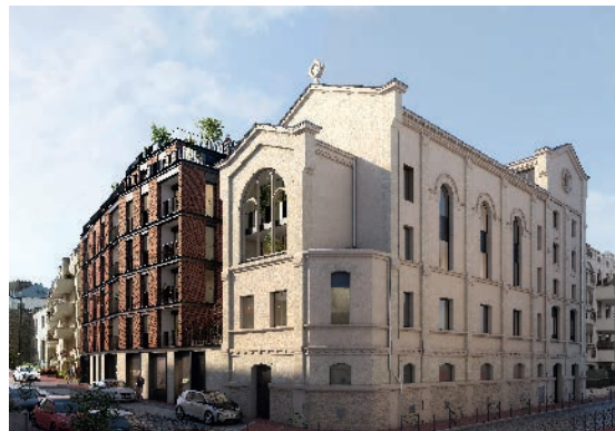
INTEMPOREL - SAINT-MANDÉ Architecte : Jean-Michel Wilmotte