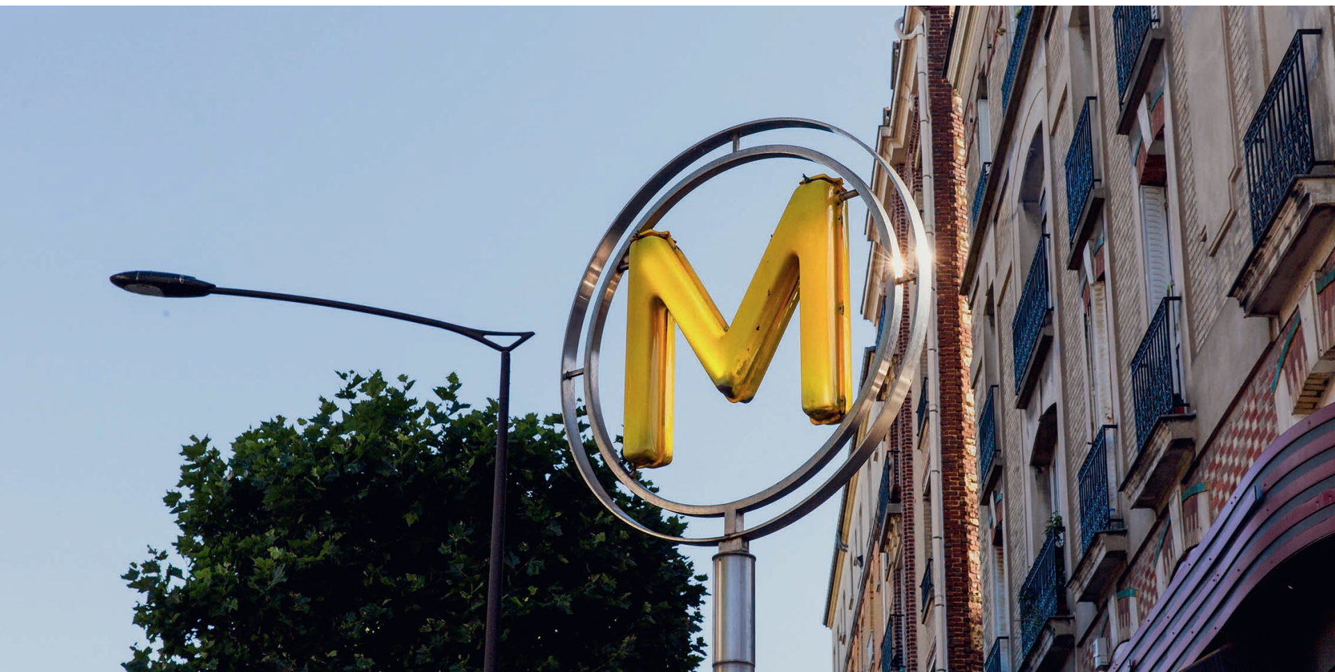
Méto station Jean Jaurès

Cultivant l'art de vivre, Boulogne-Billancourt séduit par son charme remarquable.