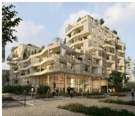
HARMONIE - RUEIL MALMAISON Architecte : Hérault Arnod Architectures