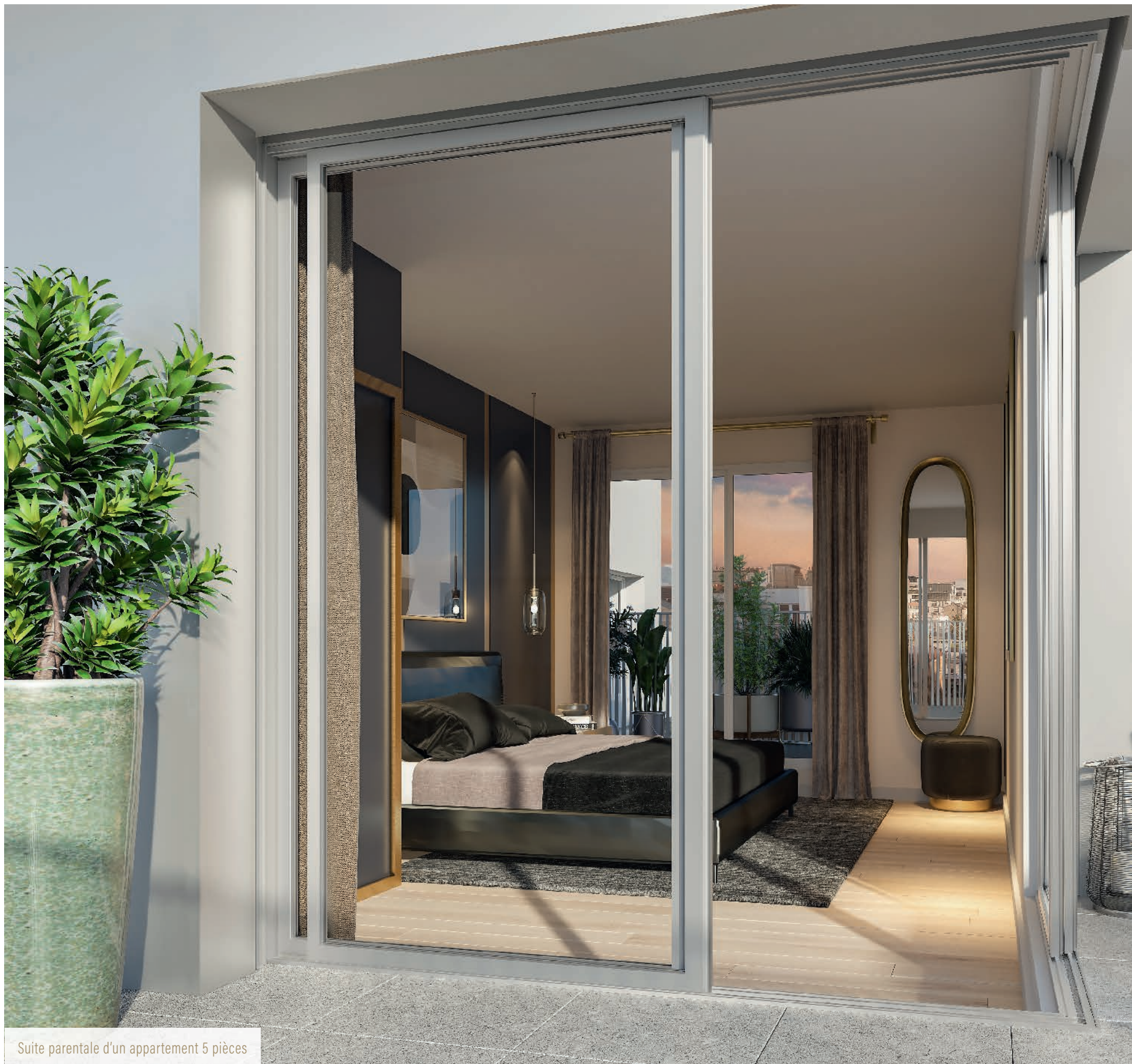
Suite parentale d'un appartement 5 pièces