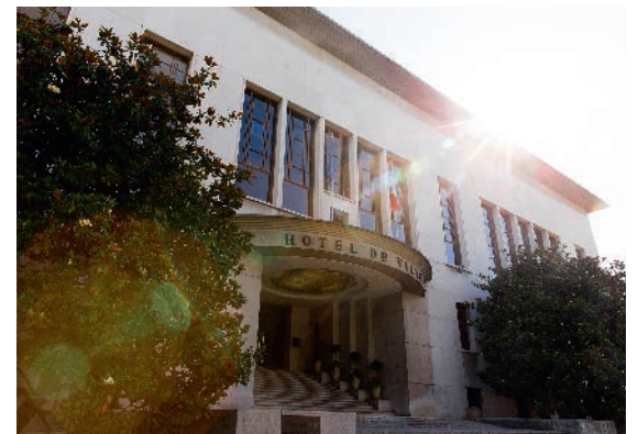
Mairie de Boulogne