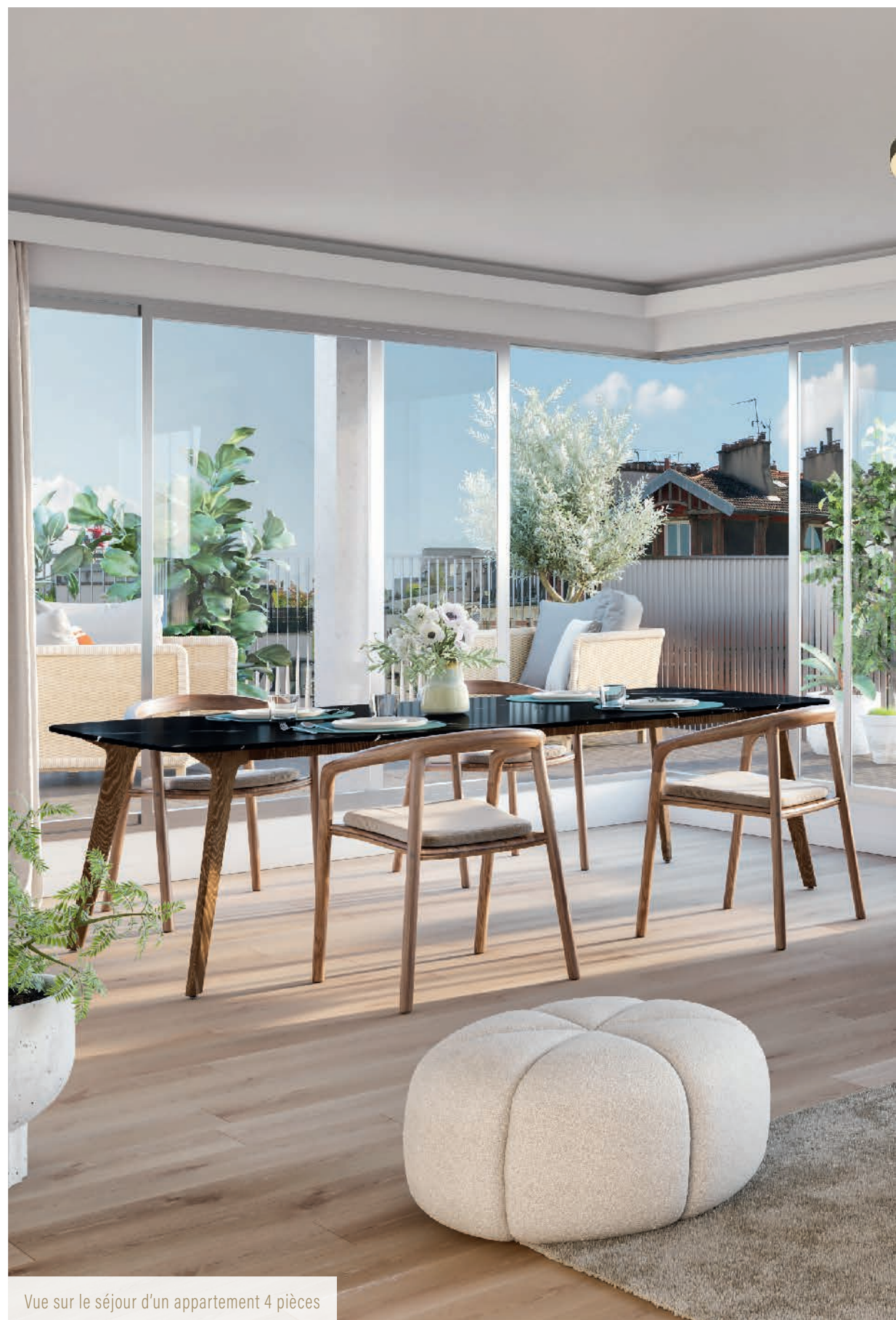
Vue sur le séjour d'un appartement 4 pièces

Pour couronner cette façon de vivre la ville de manière exceptionnelle, les duplex en attique se prolongent sur des espaces plein ciel et aménageables dans certains cas, répondant aux envies de chacun.